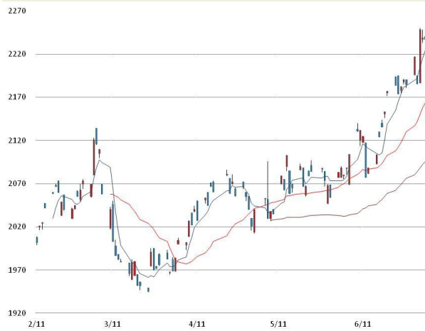
아연 가격과 이동평균선(5, 20, 60)