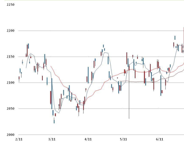
납 가격과 이동평균선(5, 20, 60)