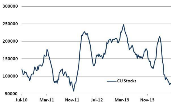
[그림 3] 증가한 상해 거래소 전기동 재고