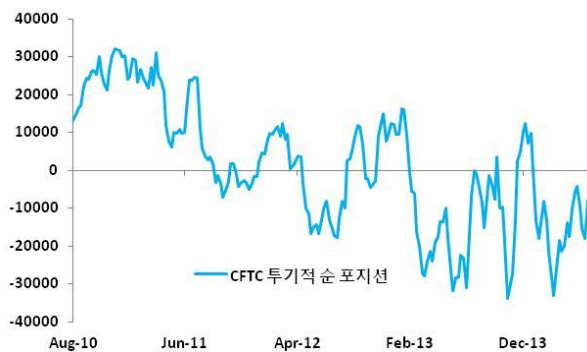
[그림 1] 투기적 매수 증가로 상승한 전기동

중요한건 지금의 추세가 지속될 수 있을까하는 것이다. 지금의 상승이 펀더멘탈과 상관없이 투기적 포지션에 의한 움직임이라면 답은 정해져 있기 때문이다. 사지말고 기다려라. 예전 수준까지 빠지는건 아니지만 어느 수준의 하향조정은 피할 수 없다고 본다. 실제로 많은 참여자들이 현 수준에서 신규 매도포지션을 잡아야 한다고 말하고 있다. 물론, 여전히 신규 매수도 있지만 매도를 늘리려는 움직임 강해 보인다. 거기에 가격도 강한 저항선에 가로막혀 더 이상 앞으로 나아가는게 힘들어 보인다. 물론, 빠진다고 확 빠질 것 같지 않지만. 일단은 지난 주 상해거래소 전기동 재고가 증가한 점과 한국 부산창고의 재고도 증가했던 점이 악재로 작용하고 있는 상황. 분위기가 완전 하락쪽으로 기운 것은 아니지만 좀 더 건드리면 확 기울수도 있다고 본다.