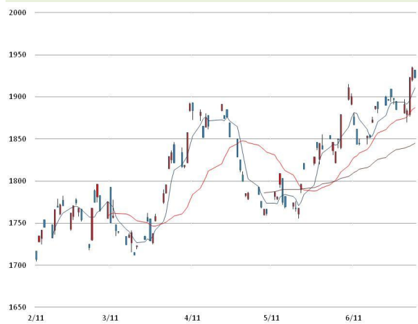
알루미늄 가격과 이동평균선(5, 20, 60)