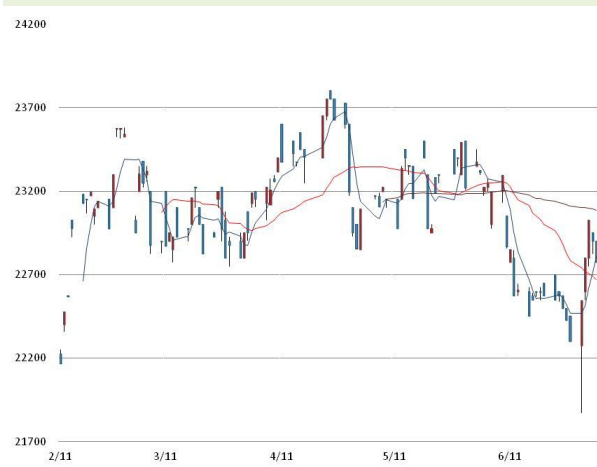
주석 가격과 이동평균선(5, 20, 60)