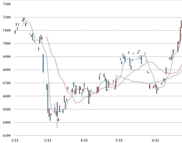
전기동 가격과 이동평균선(5, 20, 60)