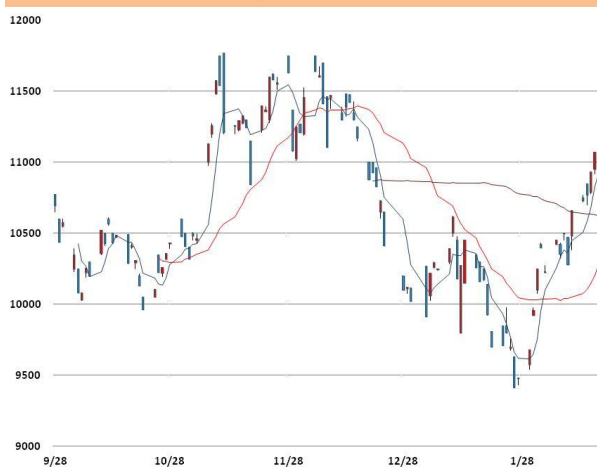
니켈 가격과 이동평균선(5, 20, 60)