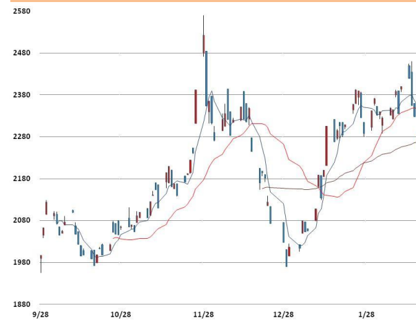
납 가격과 이동평균선(5, 20, 60)