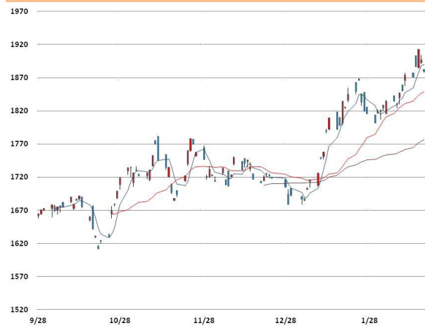
알루미늄 가격과 이동평균선(5, 20, 60)