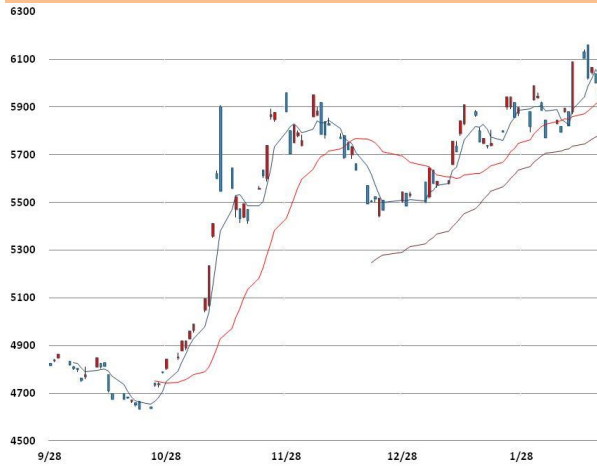
전기동 가격과 이동평균선(5, 20, 60)