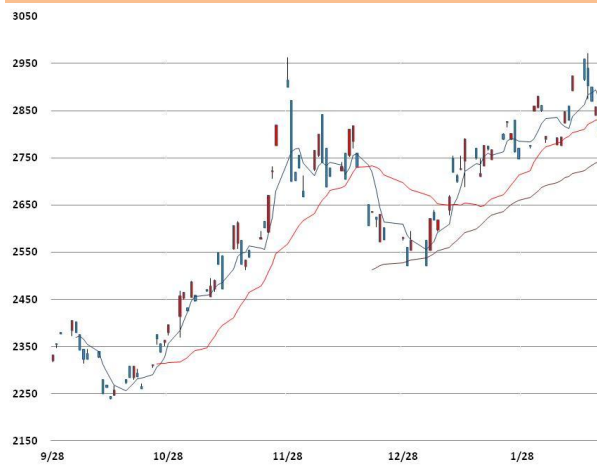
아연 가격과 이동평균선(5, 20, 60)