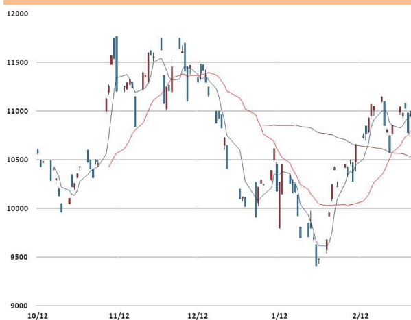
니켈 가격과 이동평균선(5, 20, 60)