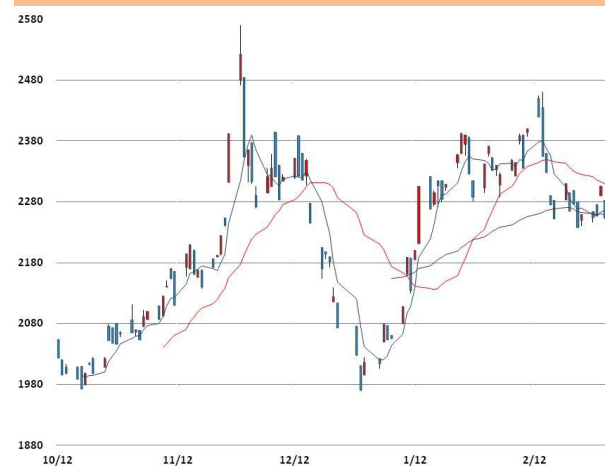
납 가격과 이동평균선(5, 20, 60)