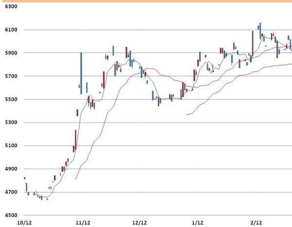
전기동 가격과 이동평균선(5, 20, 60)