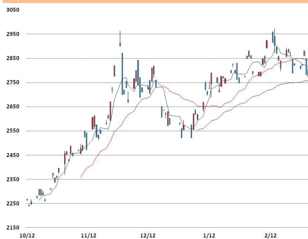
아연 가격과 이동평균선(5, 20, 60)