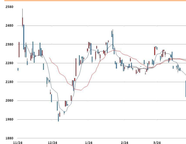
납 가격과 이동평균선(5, 20, 60)