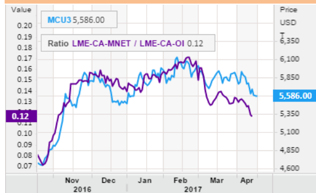
그림 2. LME CU, 가격과 투기적 비율 비교