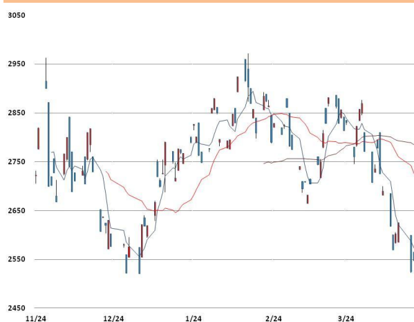
아연 가격과 이동평균선(5, 20, 60)