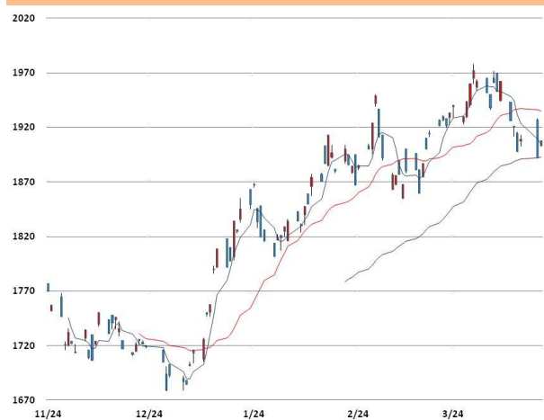
알루미늄 가격과 이동평균선(5, 20, 60)