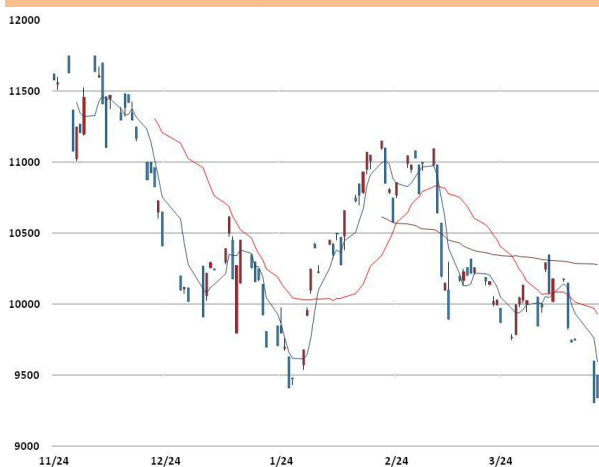
니켈 가격과 이동평균선(5, 20, 60)