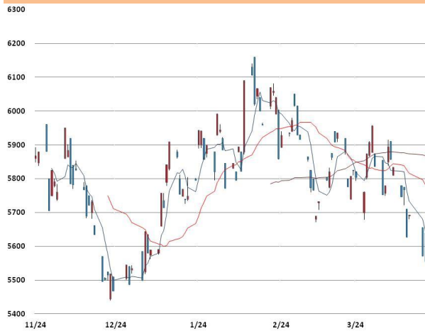
전기동 가격과 이동평균선(5, 20, 60)