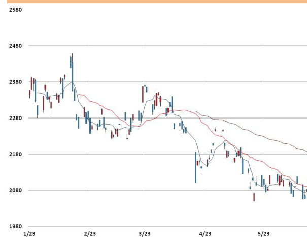
납 가격과 이동평균선(5, 20, 60)