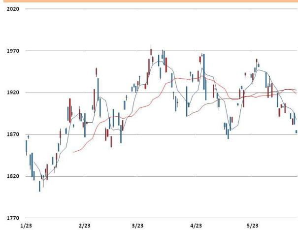
알루미늄 가격과 이동평균선(5, 20, 60)