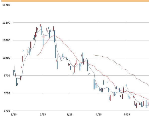
니켈 가격과 이동평균선(5, 20, 60)