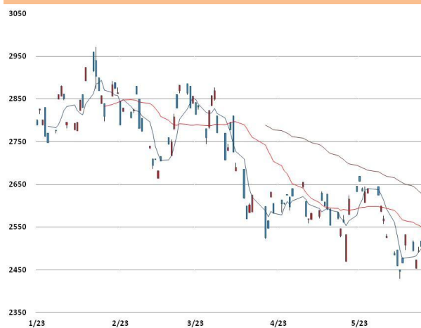
아연 가격과 이동평균선(5, 20, 60)