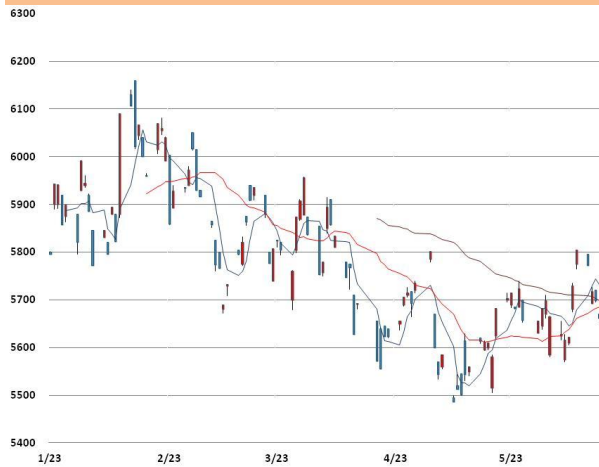
전기동 가격과 이동평균선(5, 20, 60)